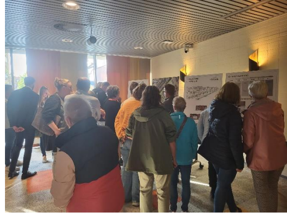
Foto's tijdens de inloopbijeenkomst

Tijdens de inloopbijeenkomst is er de buurtbewoners en belanghebbende de mogelijkheid geboden om een suggestieformulier in te vullen. Op het suggestieformulier kon men invullen of zij geïnteresseerd zijn in een woning (grondgebonden woning, grondgebonden comfort woning of appartement) en of zij nog eventuele suggesties, ideeën en/of aandachtspunten hebben op het voorgestelde nieuwbouwplan. In totaal zijn er meer dan 80 suggestieformulieren ingevuld en heeft vrijwel iedereen aangegeven geïnteresseerd te zijn in een woning en/of appartement.